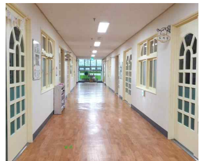
유치원 전체 LED등 교체로 원아들의 시력보호 및 밝은 환경 조성