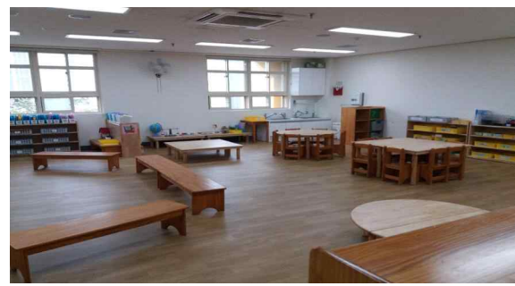
각 반 이사(다정반-2층, 슬가지혜.희망-3층) 및 교실 정비