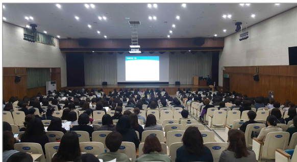
2019년 학부모회 학교참여 지원사업 설명회 (2019.3.26.)