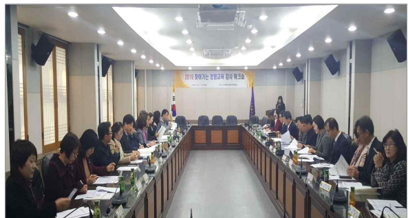
2019년 찾아가는 청렴교육 강사 워크숍 (2019.4.3.)